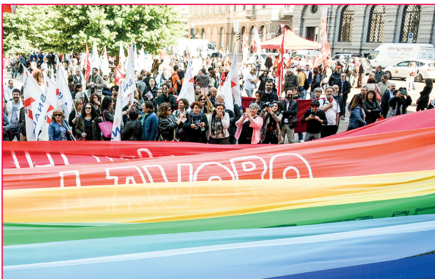
Un'immagine della manifestazione in Piazza della Scala

Pienamente riusciti la manifestazione e lo sciopero del 20 maggio